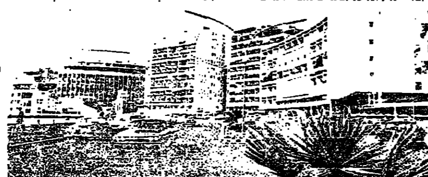
Beirut to lose the outbreak of the civil war: An elegantly livable metropolis

Six months after the July peace accords... Beirut to lose the outbreak of the civil war: An elegantly livable metropolis